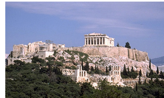
Athen – Geburtsort der Demokratie

EUROPA BRAUCHT DEMOKRATIE DEMOKRATIE BRAUCHT DEUTSCHLAND